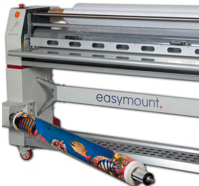
▲ EM-1600SH - cu braț tip "swing-out" pentru a facilita montarea foliei

Proiectate de VIVID, gama Easymount oferă afacerii dvs. o capacitate suplimentară, permițându-vă să oferiți clienților un serviciu complet.