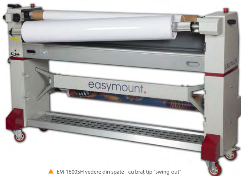
▲ EM-1600SH vedere din spate - cu braț tip "swing-out" pentru a facilita montarea foliei

Easymount EM-1600SH și EM-A1600SH au acum un braț tip "swing-out" atât pe partea din față cât și pe partea din spate a sistemului. Brațele fac încărcarea ambelor role mult mai ușor și mai rapid, fără compromisuri în finisaj.